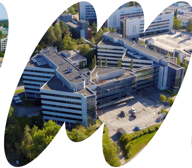
Karamalmi: tekniikka (ICT)