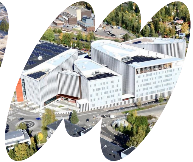
Myllypuro: sosiaali- ja terveysala tekniikka (rakennusala) liiketalous